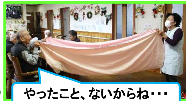
やったこと、ないからね…