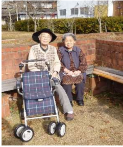
仲良しさんと一緒に♡